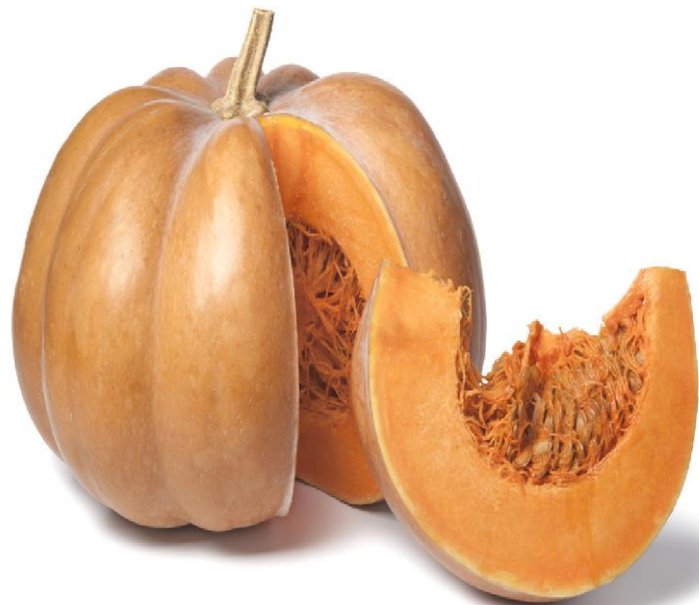
C O U R G E