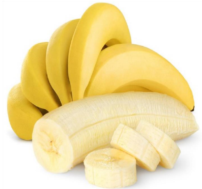
B A N A N E