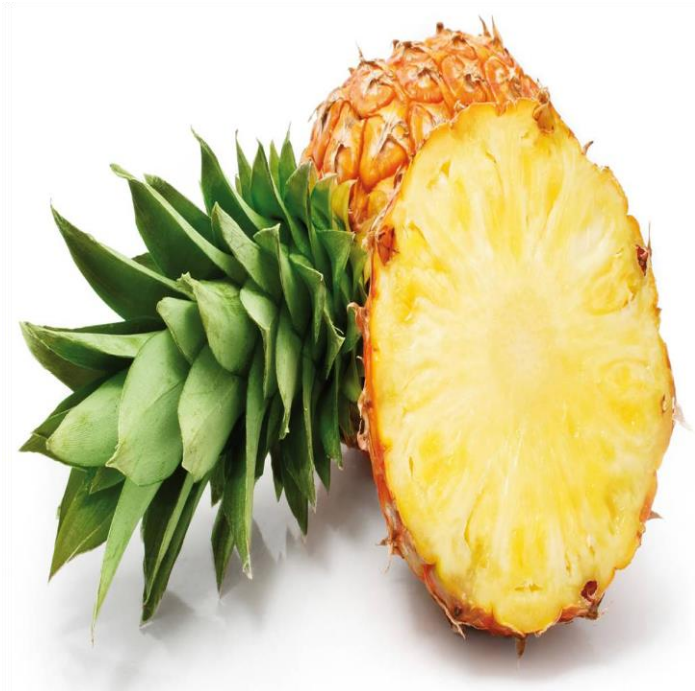
A N A N A S