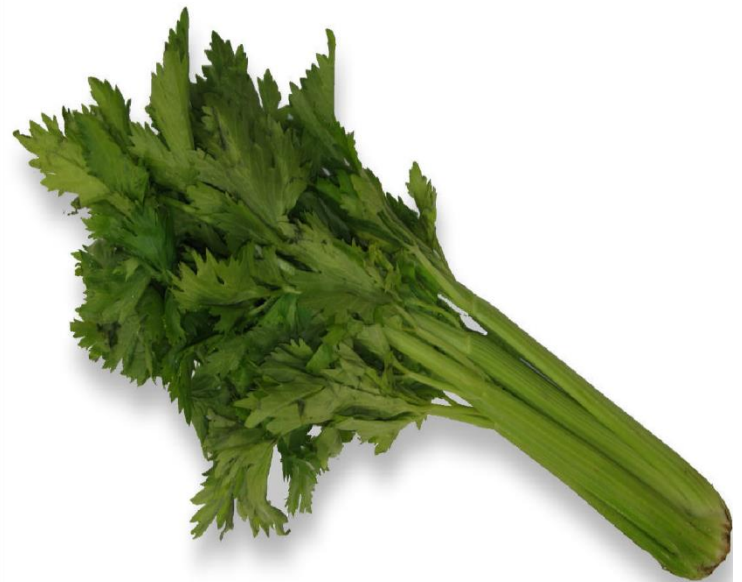
C E L E R I B R A N C H E