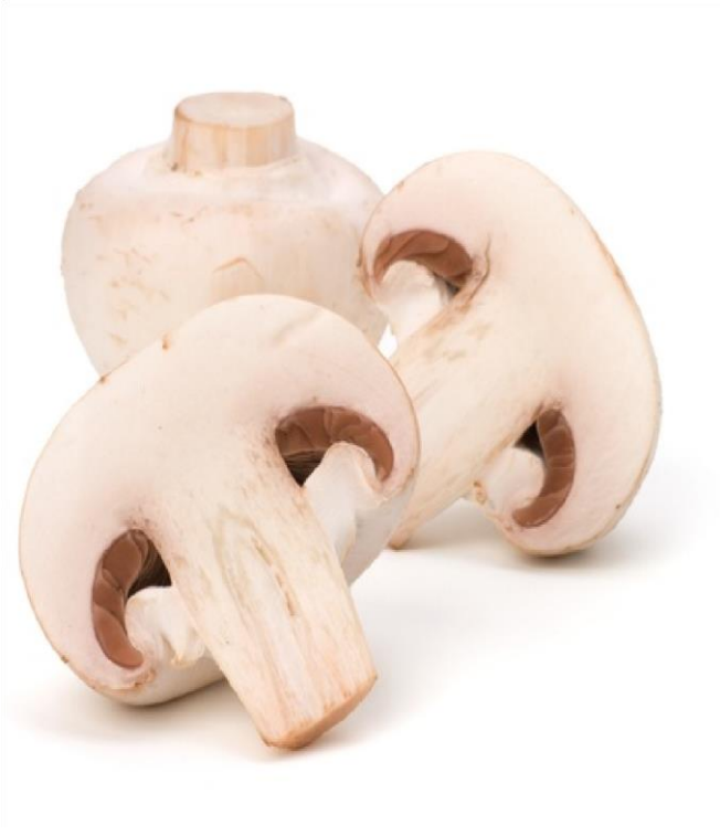
champignon de Paris